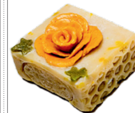
ZUB ČASU pro zralou pleť květ lípy absolue a vybraná másla a oleje